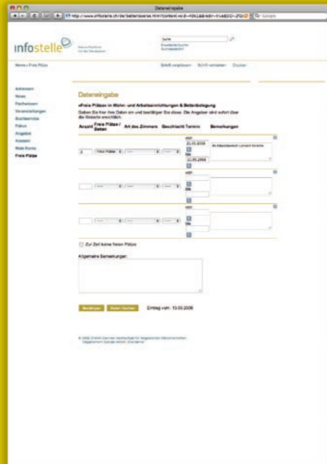
Eingabemaske für Organisationen

Institutionen, die im Online-Verzeichnis «Soziale Hilfe von A-Z» eingetragen sind, haben die Möglichkeit, ihre freien Plätze unkompliziert über die Website www.infostelle.ch einzugeben und zu verwalten. Der Adresseintrag in das Verzeichnis ist kostenlos. Für die Benutzung des Tools «Freie Plätze» ist ein Abonnement Voraussetzung (Preise siehe www.infostelle.ch -> Angebot). Mit diesem Abonnement erhalten Sie zusätzlich Zugriff auf die Adressen und Leistungen von über 3000 Organisationen aus dem Sozialbereich im Kanton Zürich.